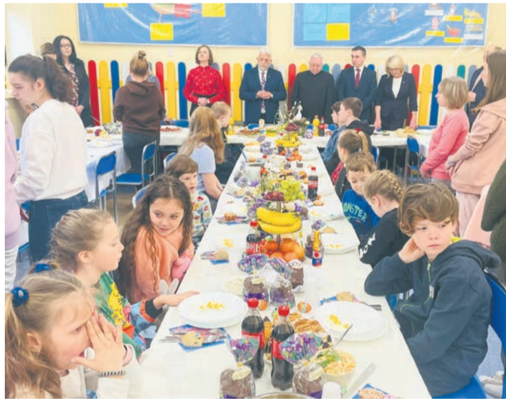
Świąteczne spotkanie z Uchodźcami

Aby wspomóc uciekinierów wojennych w Urzędzie Gminy Nieporęt powstał punkt konsultacyjno-informacyjny. Zostali też zatrudnieni tłumacze języka ukraińskiego. Bardzo sprawnie przebiega obsługa administracyjna